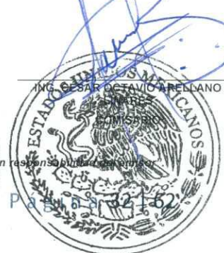
COMISARIO DE LA JUNTA DE GOBIERNO SISTEMA DE AGUA POTABLE Y ALCANTARILLADO DE ZITÁCUARO 2024-2027