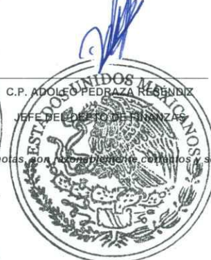
FINANZAS SISTEMA DE AGUA POTABLE Y ALCANTARILLADO DE ZITÁCUARO 2024-2027