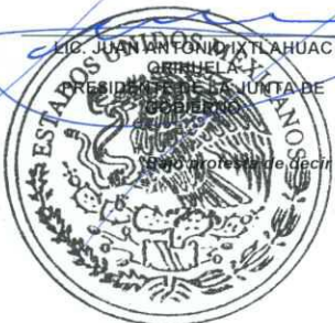
PRESIDENTE DE LA JUNTA DE GOBIERNO SISTEMA DE AGUA POTABLE Y ALCANTARILLADO DE ZITÁCUARO 2024-2027

En el Municipio no contamos con fideicomisos de ningún tipo, en caso dado que existiesen, su estructura orgánica, la integración de su patrimonio y los estados financieros, se determinarán de conformidad a las reglas establecidas y proporcionadas de acuerdo con las disposiciones que para tal efecto emite el Consejo Nacional para la Armonización Contable (CONAC).