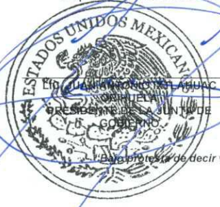
PRESIDENTE DE LA JUNTA DE GOBIERNO SISTEMA DE AGUA POTABLE Y ALCANTARILLADO DE ZITÁCUARO 2024-2027

1.2.1.4. La cuenta de PARTICIPACIONES Y APORTACIONES DE CAPITAL ; arroja un saldo por la cantidad de $ 0.00 (Cero Pesos 00/100 M.N.), mismo que se constituye del monto de las participaciones y aportaciones de capital directo o mediante la adquisición de acciones u otros valores representativos de capital en los sectores público, privado y externo.