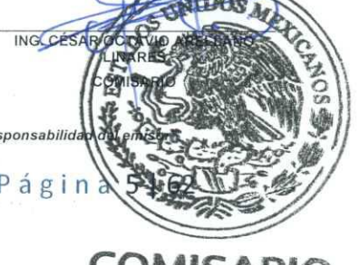
COMISARIO DE LA JUNTA DE GOBIERNO SISTEMA DE AGUA POTABLE Y ALCANTARILLADO DE ZITÁCUARO 2024-2027