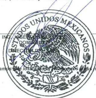
DIRECCIÓN GENERAL SISTEMA DE AGUA POTABLE Y ALCANTARILLADO DE ZITÁCUARO 2024-2027