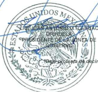
PRESIDENTE DE LA JUNTA DE GOBIERNO SISTEMA DE AGUA POTABLE Y ALCANTARILLADO DE ZITÁCUARO 2024-2027

1.2.8.3. En la cuenta de ESTIMACIONES POR PÉRDIDA DE CUENTAS INCOBRABLES DE INGRESOS POR COBRAR A LARGO PLAZO ; se identifica un saldo por un importe de $ 0.00 (Cero Pesos 00/100 M.N.) , en el cual se registra el monto de la estimación que se establece anualmente por contingencia, con el fin de prever las pérdidas derivadas de la incobrabilidad de ingresos por cobrar, emitidos en un plazo mayor a doce meses.