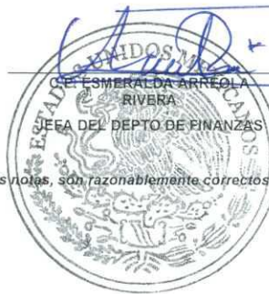
FINANZAS SISTEMA DE AGUA POTABLE Y ALCANTARILLADO DE ZITÁCUARO 2024-2027