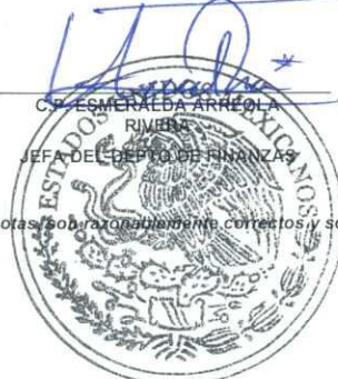
FINANZAS SISTEMA DE AGUA POTABLE Y ALCANTARILLADO DE ZITÁCUARO 2024-2027