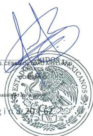
COMISARIO DE LA JUNTA DE GOBIERNO SISTEMA DE AGUA POTABLE Y ALCANTARILLADO DE ZITÁCUARO 2024-2027