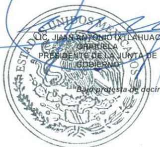
PRESIDENTE DE LA JUNTA DE GOBIERNO SISTEMA DE AGUA POTABLE Y ALCANTARILLADO DE ZITÁCUARO 2024-2027

4.1.4 En el rubro de DERECHOS ; se indica un saldo por la cantidad de $ 0.00 (Cero Pesos 00/100 M.N.) , importe que se conforma del total de contribuciones establecidas en Ley por el uso o aprovechamiento de los bienes del dominio público, así como por recibir servicios que presta el Estado en sus funciones de derecho público, excepto cuando se presten por organismos descentralizados u órganos desconcentrados cuando en este último caso, se trate de contraprestaciones que no se encuentren previstas en las leyes correspondientes. También son derechos las contribuciones a cargo de los organismos públicos descentralizados por prestar servicios exclusivos del Estado.