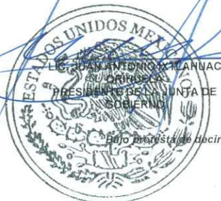
PRESIDENTE DE LA JUNTA DE GOBIERNO SISTEMA DE AGUA POTABLE Y ALCANTARILLADO DE ZITÁCUARO 2024-2027

En lo que respecta a la fecha de presentación de los estados financieros y presupuestales, no se presentaron cambios en la estructura orgánica básica del Sistema de Agua Potable y Alcantarillado de Zitácuaro, siendo la misma que se aprobó al inicio del ejercicio fiscal vigente, mismas que se a continuación se muestra.