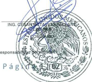
COMISARIO DE LA JUNTA DE GOBIERNO SISTEMA DE AGUA POTABLE Y ALCANTARILLADO DE ZITÁCUARO 2024-2027