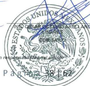
COMISARIO DE LA JUNTA DE GOBIERNO SISTEMA DE AGUA POTABLE Y ALCANTARILLADO DE ZITÁCUARO 2024-2027