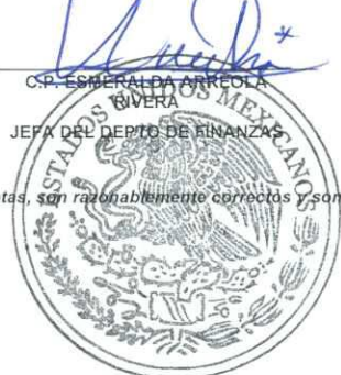
FINANZAS SISTEMA DE AGUA POTABLE Y ALCANTARILLADO DE ZITÁCUARO 2024-2027