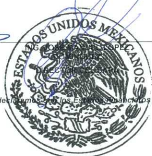
DIRECCIÓN GENERAL SISTEMA DE AGUA POTABLE Y ALCANTARILLADO DE ZITÁCUARO 2024-2027